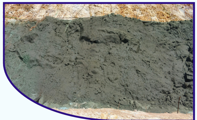
● Aplikasi Media GREEN STIQSLOPE® dengan Benih LCC di Atas Lapisan EGLUE